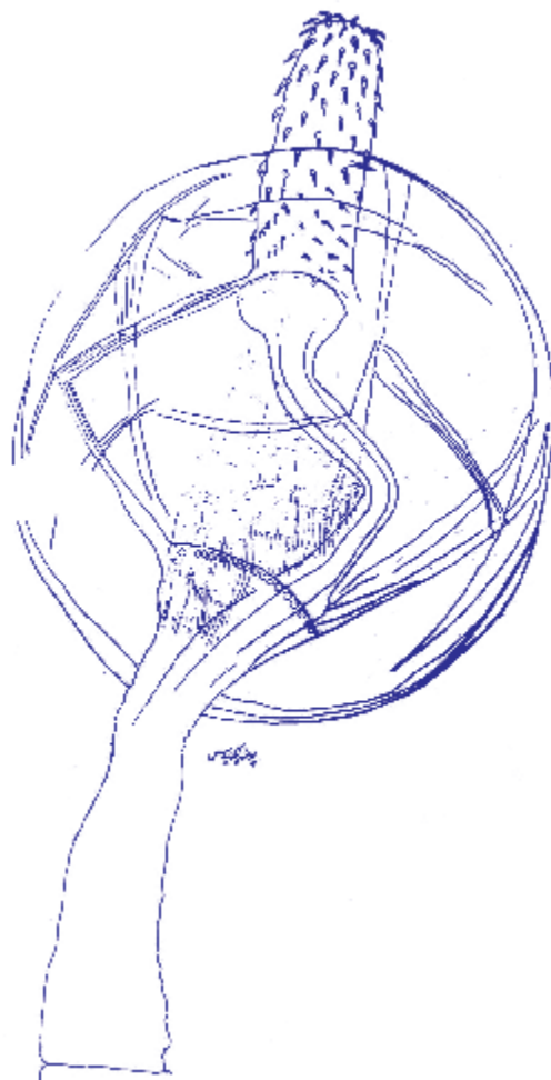
عکس شماره دو: انتهای قدامی ترسیمی انگل P.laevis یافت شده (ترسیم: دانشکده بهداشت دانشگاه تهران)